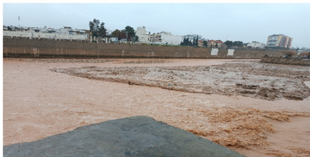
شکل ۲: نمایی از تالاب مهارلو در شرایط خشک‌سالی و کمبود آب (بالا) و سیلاب ۲۶ بهمن‌ماه ۱۴۰۳ (پایین)